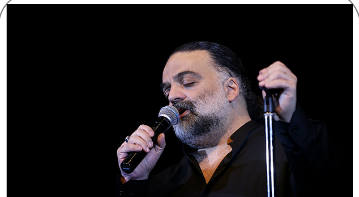
کنسرت علیرضا عصار پس از شش سال