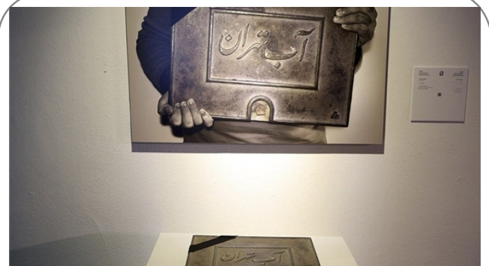
نهمین جشنواره هنرهای تجسمی فجر - «سوگواری برای آب» کاری از «علیرضا ذاکری»