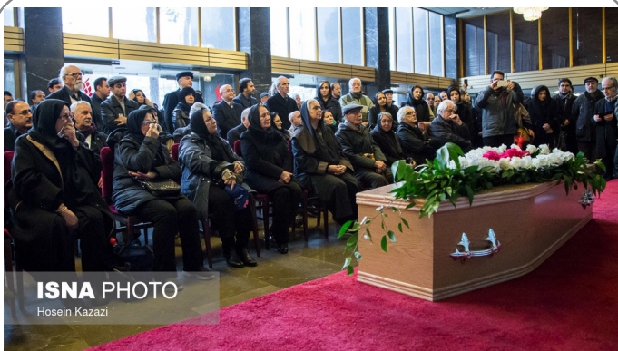
مراسم تشییع پیکر رکن الدین خسروی هنرمند تئاتر