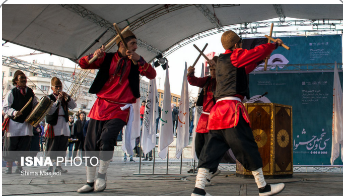
نمایش محیطی گروه معلول و نابینا در محوطه تئاتر شهر