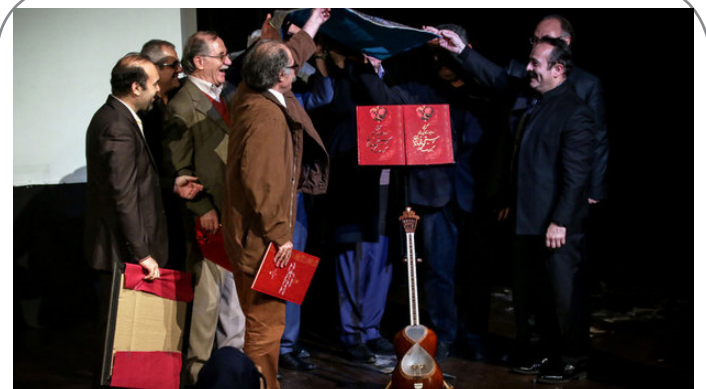
رونمایی از گزیده ردیف‌های کاربردی موسیقی ملی ایران، تألیف استاد کیوان ساکت