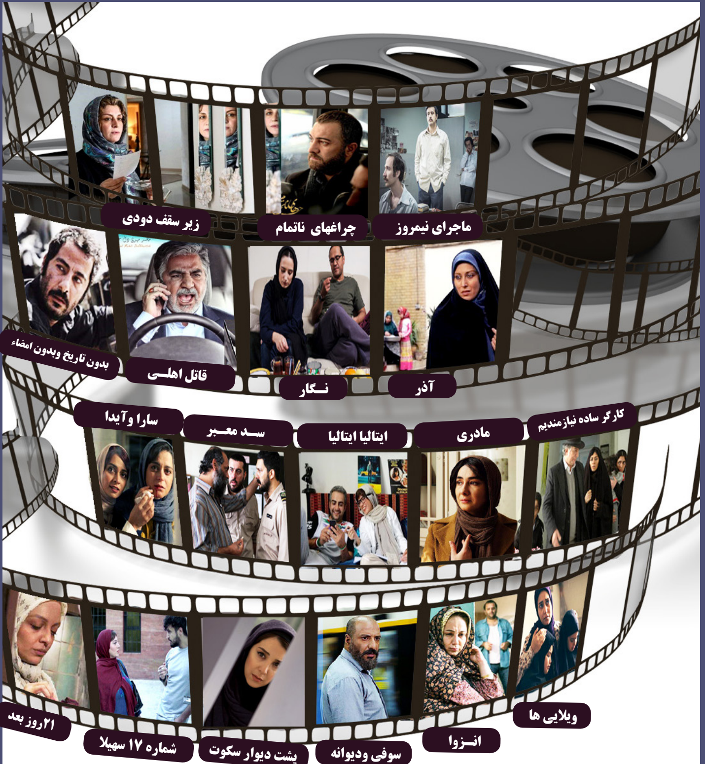
زیر سقف دودی