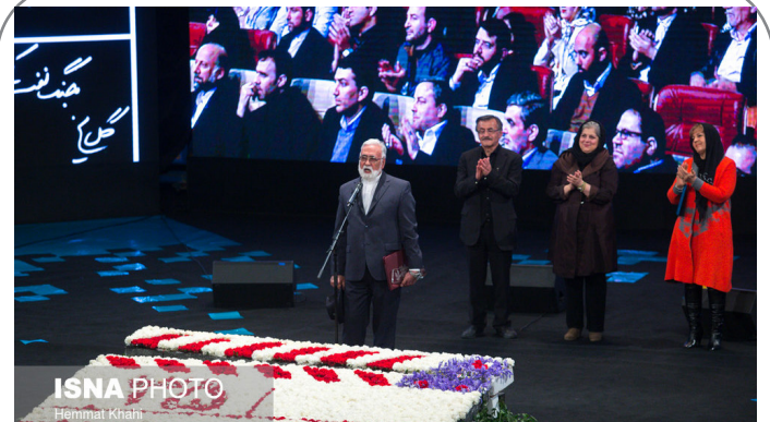
افتتاحیه سی و پنجمین جشنواره فیلم فجر