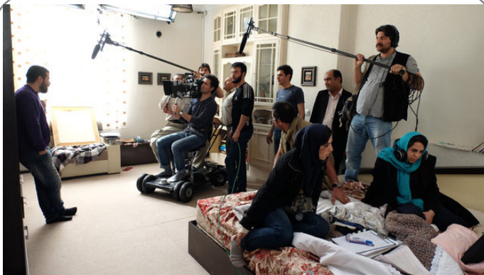
پشت صحنه فیلم سینمایی «مادری» کاری از رقیه توکلی